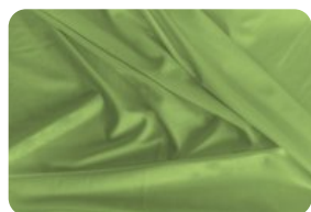
67.4005 IVAFLEX VERDE ABACATE