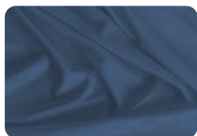
67.5002 IVAFLEX AZUL MARINHO