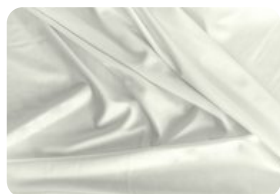
67.0002 IVAFLEX OFFWHITE