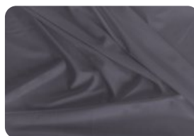
67.8001 IVAFLEX CINZA CHUMBO