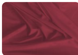
67.1003 IVAFLEX VERMELHO TERRA