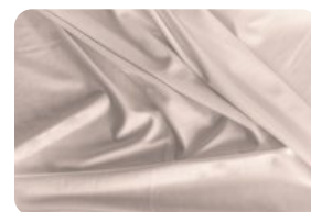
67.9002 IVAFLEX BEGE AREIA