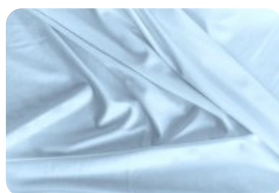
67.5003 IVAFLEX AZUL CÉU