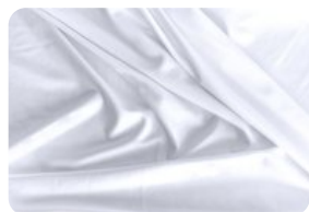
67.0001 IVAFLEX BRANCO