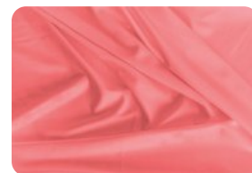
67.2003 IVAFLEX LARANJA CORAL