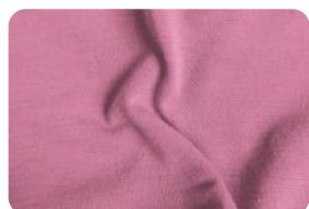
308.7002 MALHA FLAT ROSA CHÁ