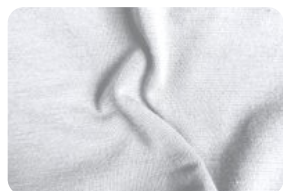
308.0001 MALHA FLAT BRANCO