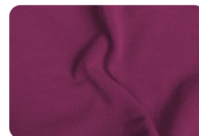
308.7001 MALHA FLAT ROSA VIOLETA