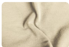
308.9003 MALHA FLAT BEGE PALHA