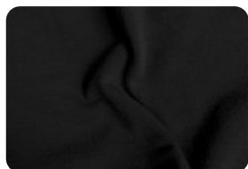
308.0032 MALHA FLAT PRETO