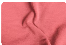
308.2003 MALHA FLAT LARANJA CORAL