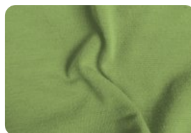
308.4005 MALHA FLAT VERDE ABACATE